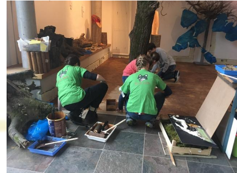
Unsere „Kleinen Wölfe“ haben die Vorbereitungen tatkräftig unterstützt.

Die Ausstellung in der Scheune steht dieses Jahr unter dem Motto „Wurzelteller & Rindenschmaus“. In verschiedenen Exponaten wird der Lebenskreislauf des Waldes dargestellt. Die Ausstellung kann bis Ende Oktober während der Öffnungszeiten des Shops besucht werden und ist natürlich, ganz im Sinne des Fördervereins, kostenfrei.